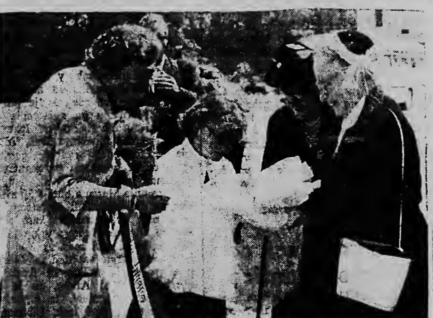
Siman pasa tabatin un defile di hendenan bieuw pa S.M. La Reina Juliana na Soestdijk. E foto aki ta muestra con dos di e damanan bieuw di e grupo di Amsterdam a ofrece un popchi pa Prinses Marijke.